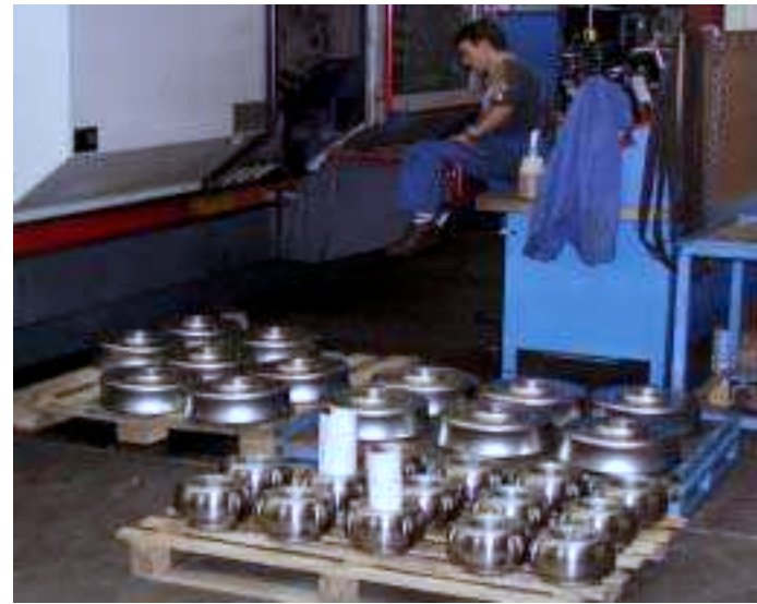
Serie von Rollen für Seitenschneidmaschinen