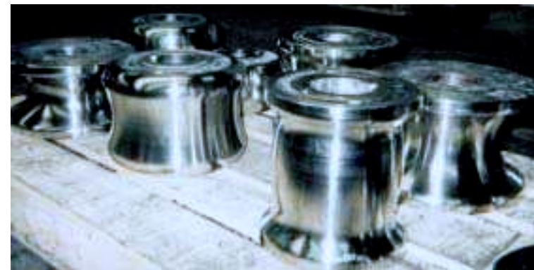
Schleifen von vorhandenen Rollen