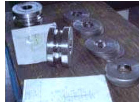
Rollen für Schneidarbeiten