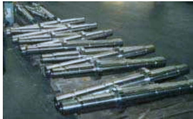
Achsen für Richtrollen / Umformrollen