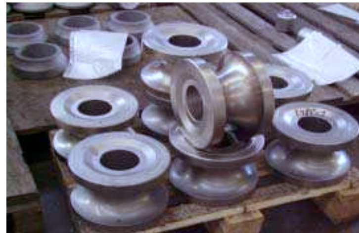
Kalibrierrollen nach der Vergüten