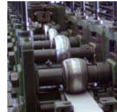
Klassischer Arbeitsgang beim Umformen