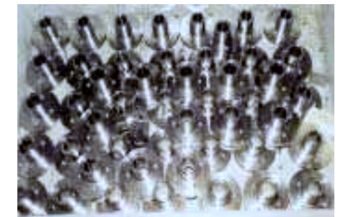
Träger aus Stahl für Schrumpffrollen