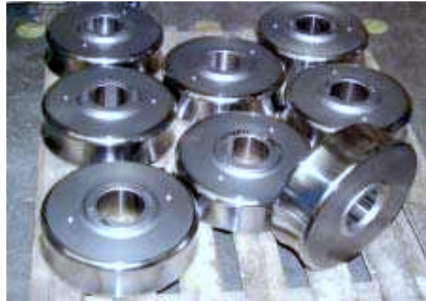
Rolle aus Z155CDV12.1 vergütet auf 58/60HRC