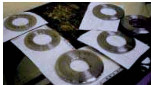
Messer zum Längsschneiden von Blechen