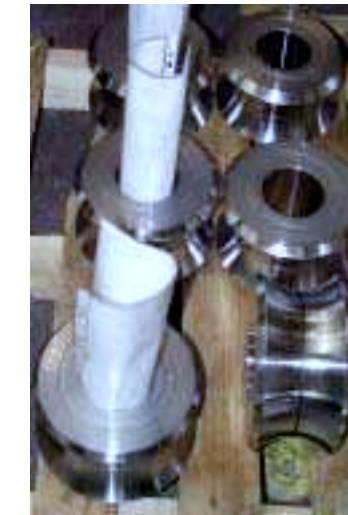
Schweißrollen aus Werkzeugstahl 40CrMoV5 vergütet auf 52/54 HRC