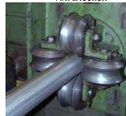
Führungsrollen für runde Rohre