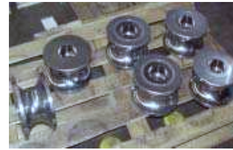
Rollen mit CrN Überzug