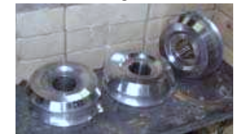
Rollen zum Herunterwalzen