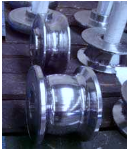
Umformrollen in W-Form